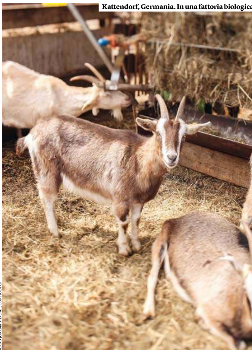
Kattendorf, Germania. In una fattoria biologica

Fa infuriare gli agricoltori bio anche l'abolizione, prevista nel documento dell'Unione europea, di tutte le eccezioni ammesse. Come va applicata la norma che impone di usare solo sementi biologiche o foraggio biologico se sul mercato non se ne trovano a sufficienza? E come fa un'azienda agricola che passa dal convenzionale al biologico a sopravvivere ai tre anni di transizione, se tutto quello che produce in quei tre anni non può venderlo? Particolarmente