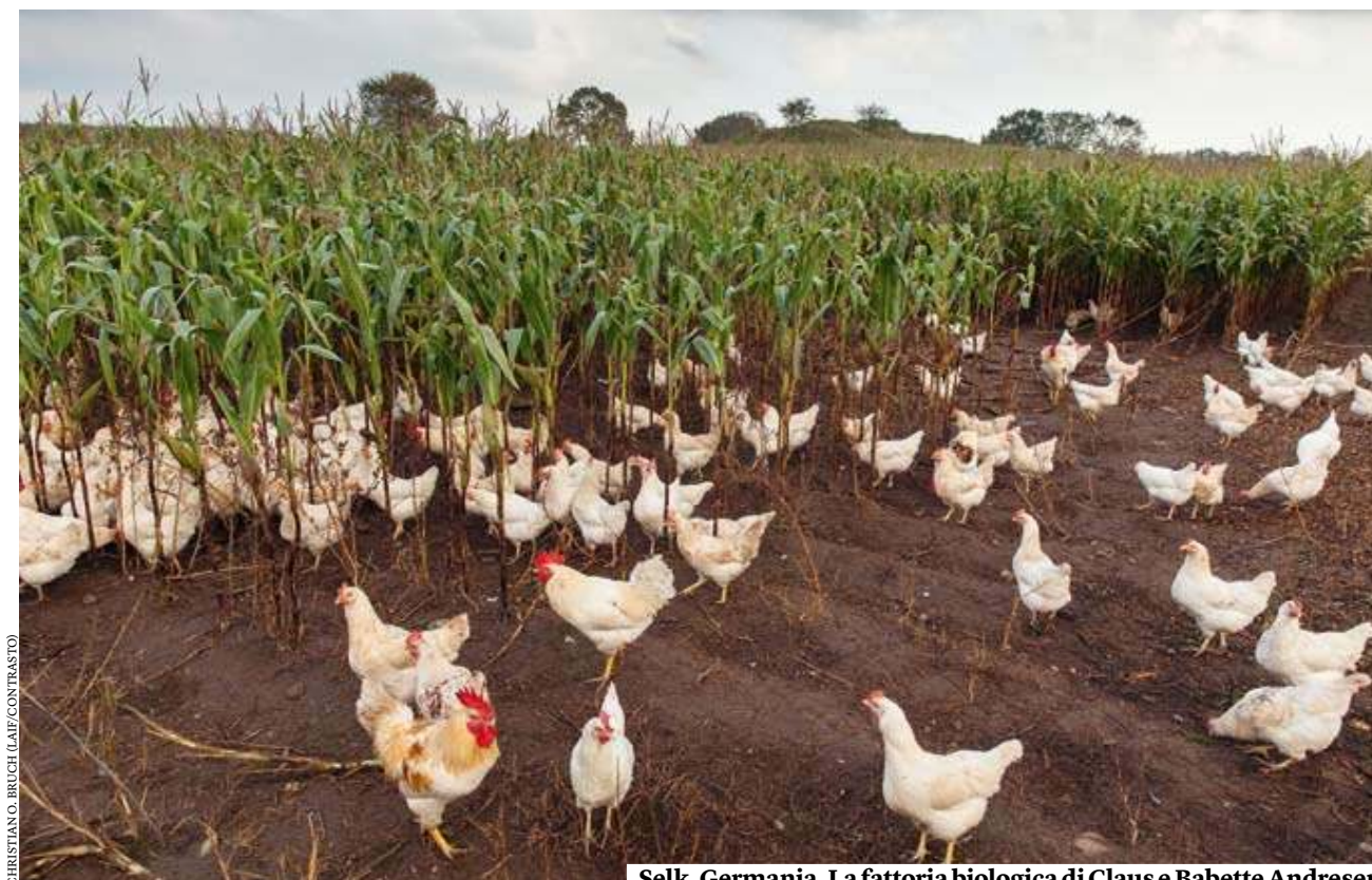
CHRISTIANO BRUCH (L'AI/CONTRASTO)